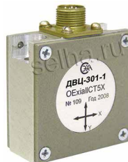
ДВЦ-301 (от 1 до 16 шт.)