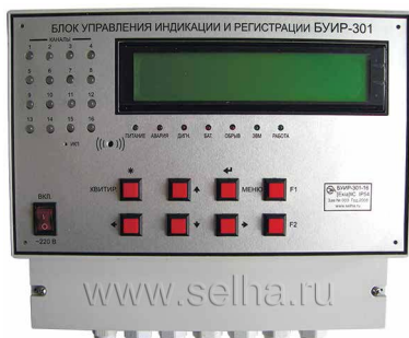
БУИР-301-16-ВЦ (1 шт.)

Сертификат соответствия № РОСС RU.МЕ92.В02366, № РОСС RU.МЕ92.В02446